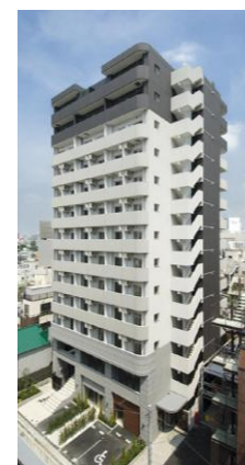
▲ スクエア渋谷外観